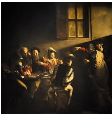
La Vocación de San Mateo (Caravaggio)

Caravaggio es uno de las figuras más importantes de la pintura barroca. Sus obras se caracterizan por representar escenas religiosas y mitológicas sin ninguna idealización. Los personajes son representados con naturalidad y realismo, con todos sus defectos. Además, las escenas oscuras aparecen iluminadas de forma tenue y con fuertes contrastes de luz y sombra, un estilo que se denomina tenebrismo y que tuvo mucha influencia en otros pintores europeos. Entre sus obras podemos destacar La vocación de San Mateo (1600), Santo Entierro (1604), Jugadores de cartas, Mujeres tocando el laúd, El entierro de Santo Tomás, La buenaventura, etc.